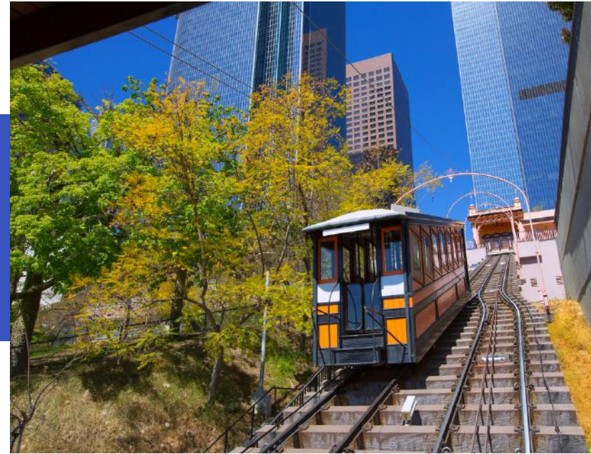
Angels Flight Railway