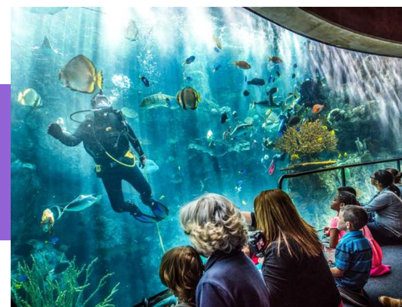
Aquarium of the Pacific