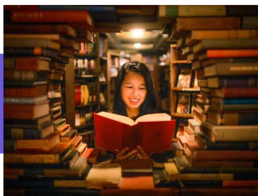
The Last Bookstore