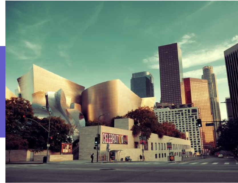
Disney Concert Hall