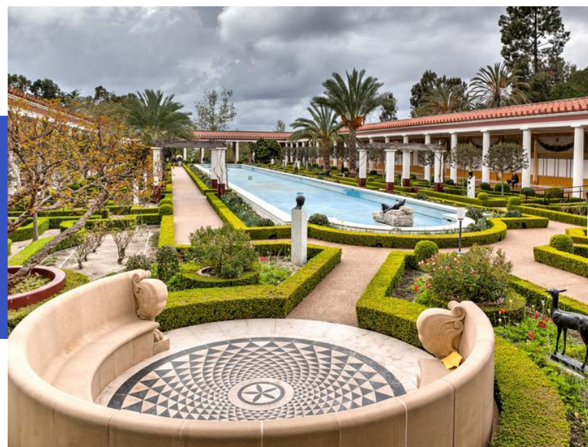
The Getty Villa