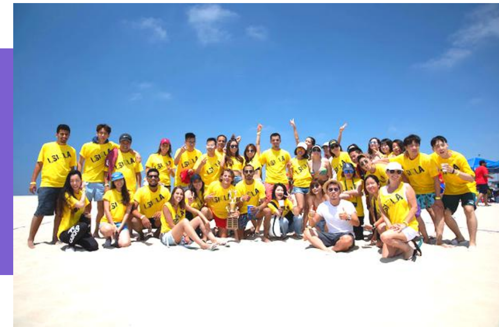
Festa na praia em Santa Mônica.