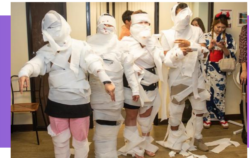
Festa de Halloween.