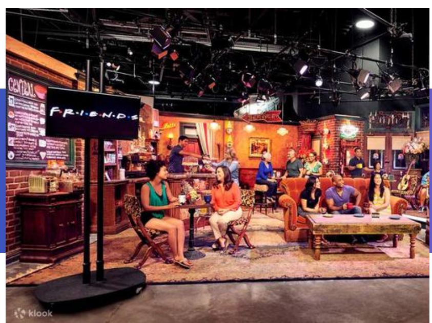
Warner Bros Studio