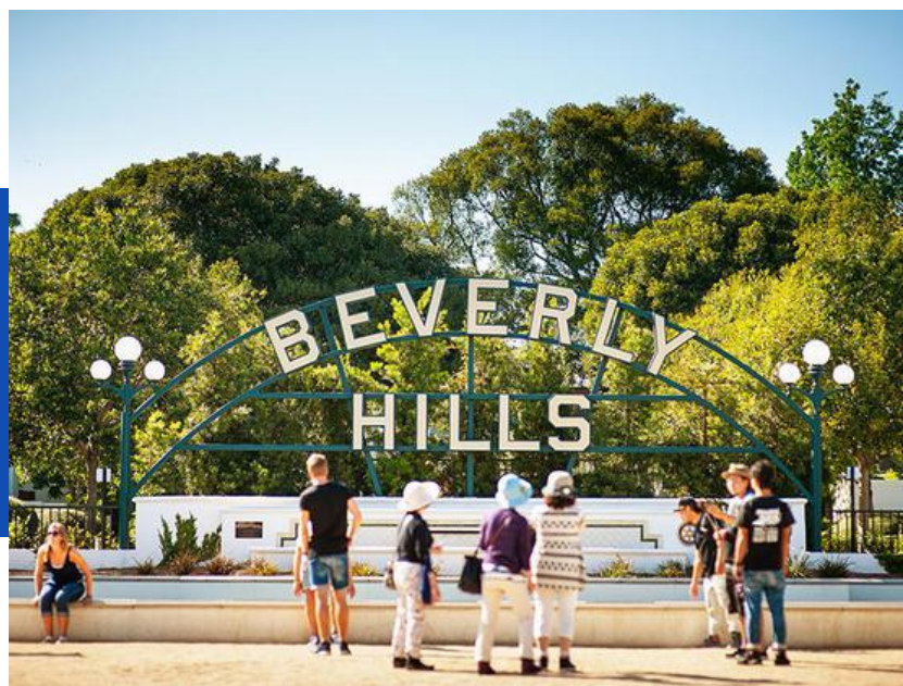
Beverly Hills Sign