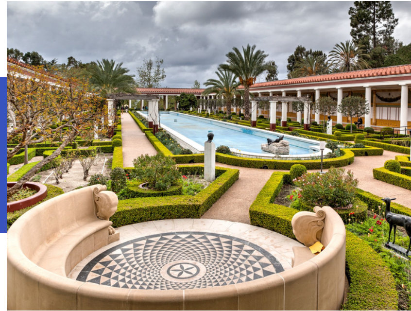
The Getty Villa