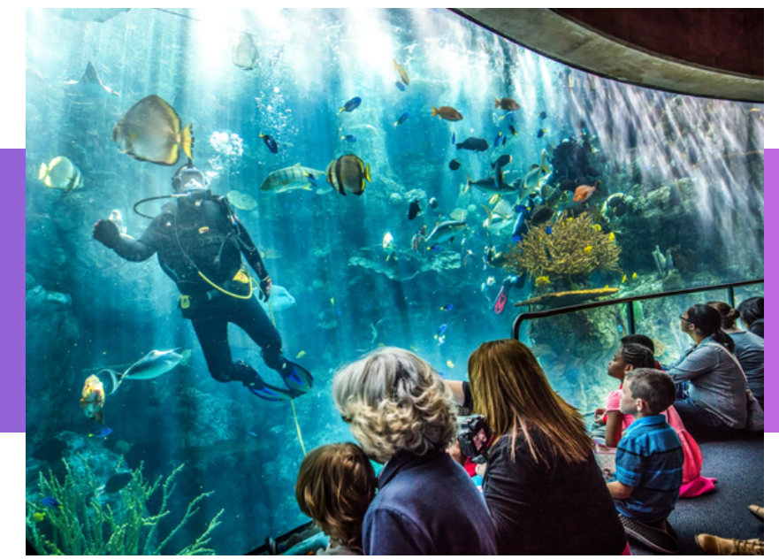
Aquarium of the Pacific