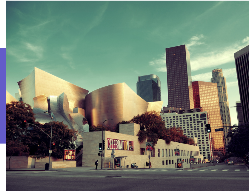
Disney Concert Hall