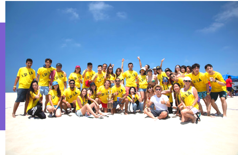
海滩派对他们 Santa Monica .