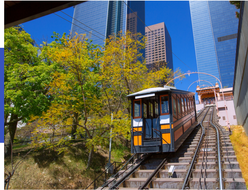
Angels Flight Railway