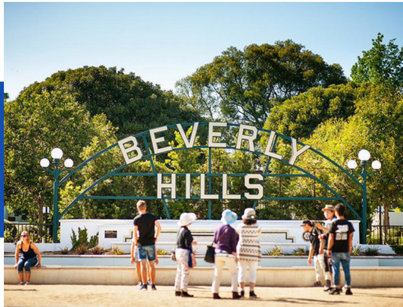
Beverly Hills Sign