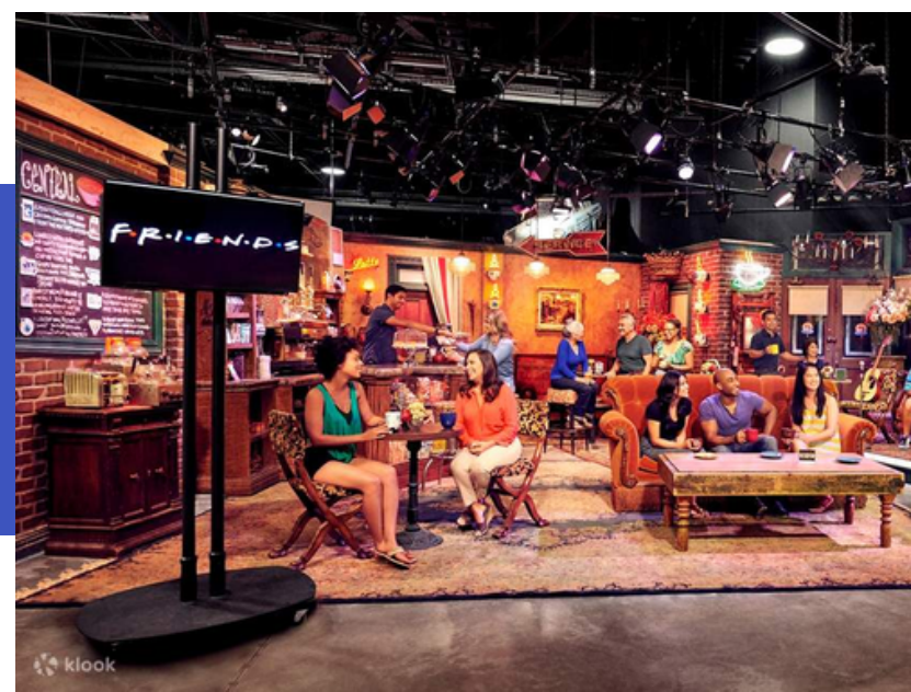
Warner Bros Studio